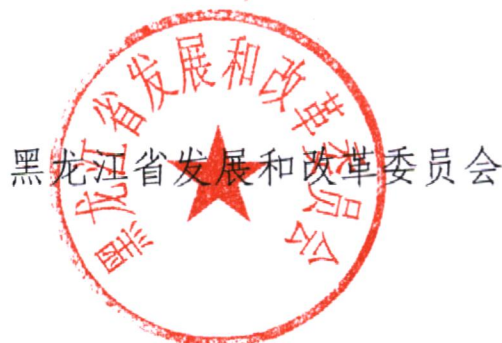
黑龙江省发展和改革委员会